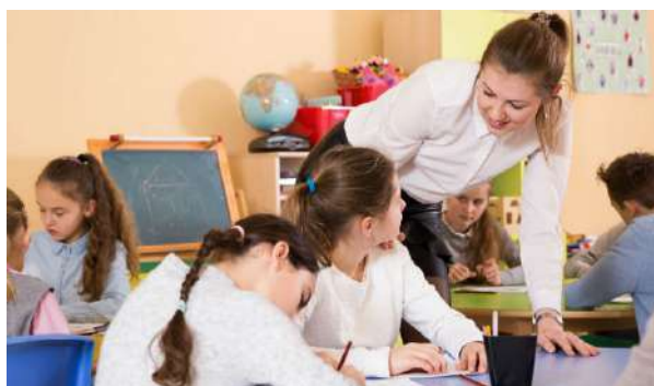
Observación de Clase en el Aula