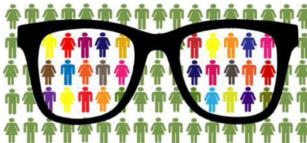
Perspectiva de Género desde la Educación Básica