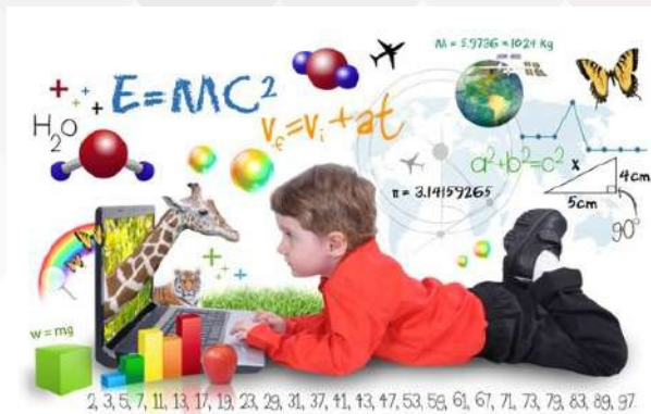
Diseño de Estrategias Didácticas para Favorecer el Desarrollo del Pensamiento Lógico Matemático