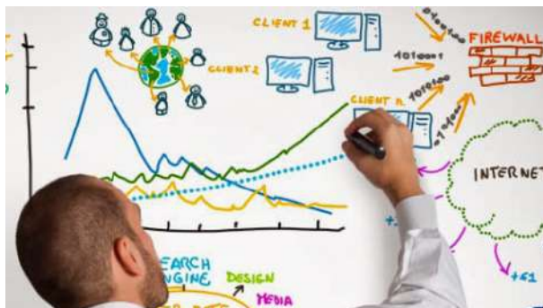
Liderazgo Pedagógico para la Construcción de Comunidades de Aprendizaje en y para la Vida (CAV)