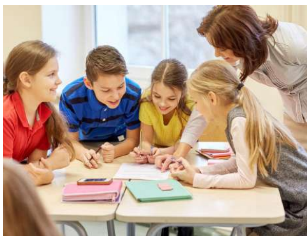
Estrategias de Seguimiento en la Zona Escolar de Telesecundaria