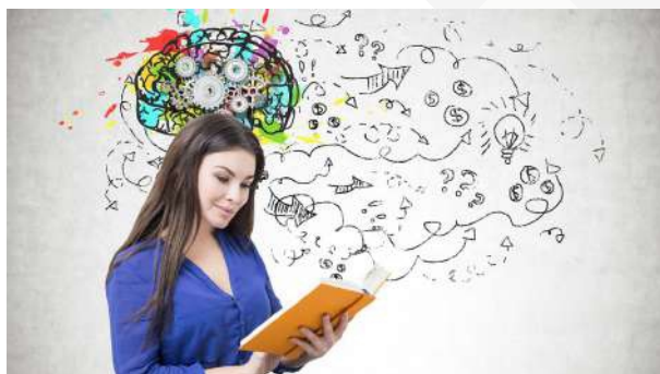
Diseño de Estrategias Didácticas para Favorecer la Lecto - Escritura