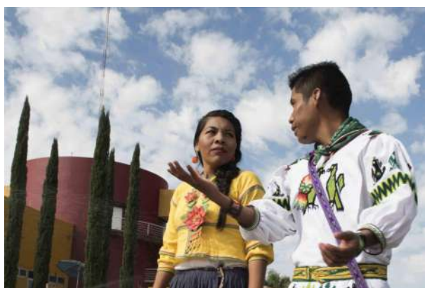
Mejora de la Didáctica para Docentes Wixaritari en Educación Básica