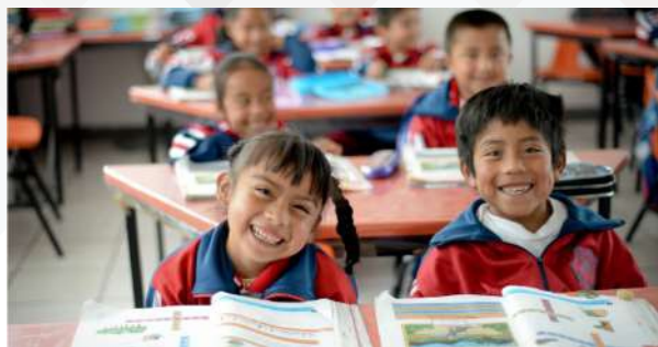
Orientaciones para la Integración de una Plan Anual de Trabajo en Educación Telesecundaria