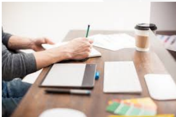
Orientación para el Diseño de Actividades de Acompañamiento a Docentes para Asesores Técnico - Pedagógicos en la Educación Básica