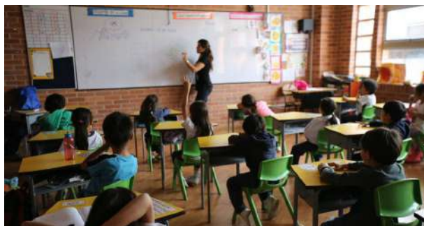
Proyecto de Enseñanza y Gestión para Contextos Indígenas