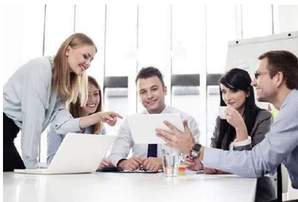
Desarrollo de Habilidades Directivas y Coaching de Alto Desempeño