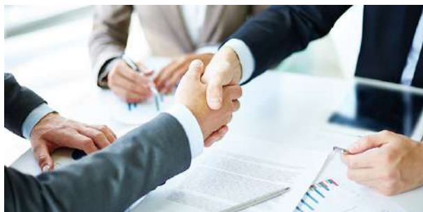
Estrategias de Intervención Didáctica para Escuelas Multigrado